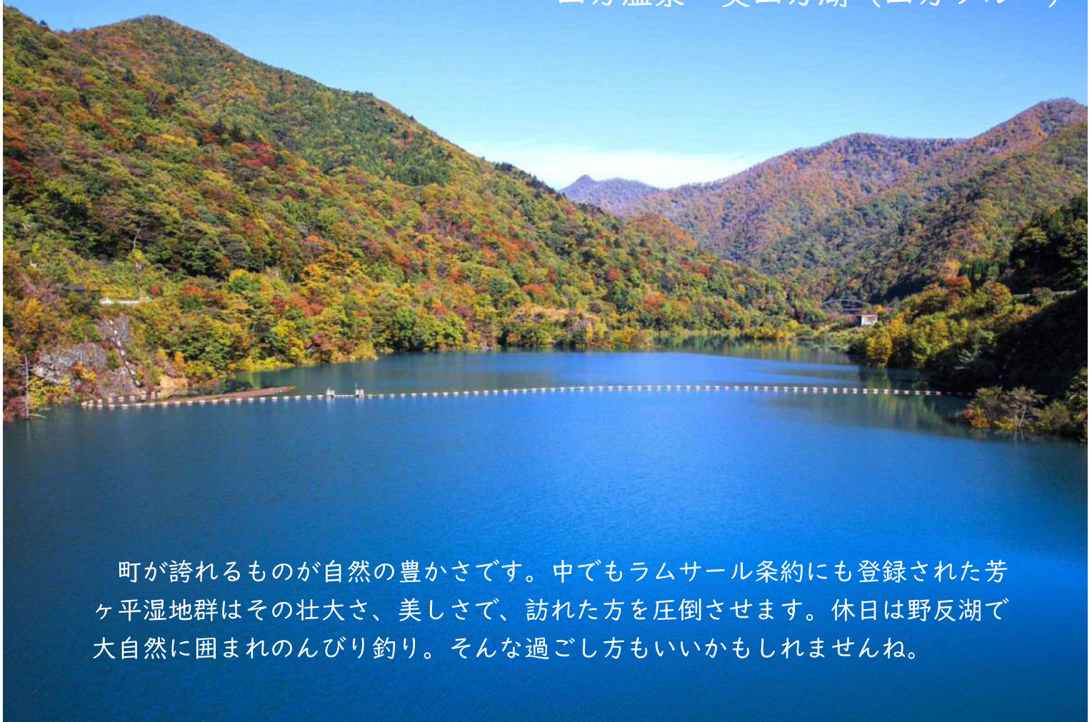
四万温泉 奥四万湖（四万ブルー）

町が誇れるものが自然の豊かさです。中でもラムサール条約にも登録された芳ヶ平湿地群はその壮大さ、美しさで、訪れた方を圧倒させます。休日は野反湖で大自然に囲まれのんびり釣り。そんな過ごし方もいいかもしれませんね。