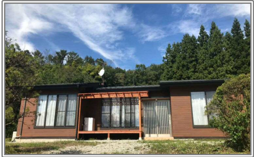
古民家を改修した移住体験住宅

中之条町では、移住希望者が「中之条で暮らす。」体験ができる「移住体験住宅」を用意しています。