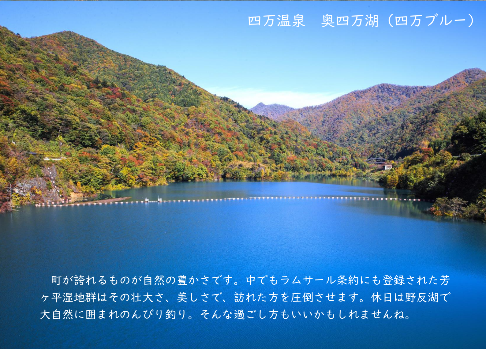
四万温泉 奥四万湖（四万ブルー）

町が誇れるものが自然の豊かさです。中でもラムサール条約にも登録された芳ヶ平湿地群はその壮大さ、美しさで、訪れた方を圧倒させます。休日は野反湖で大自然に囲まれのんびり釣り。そんな過ごし方もいいかもしれませんね。