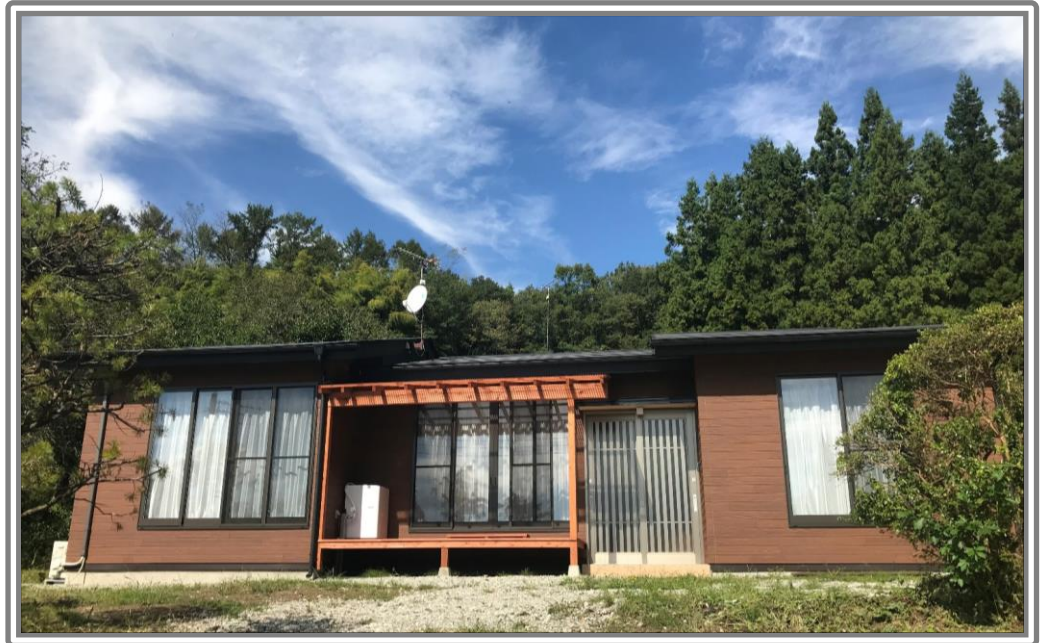
古民家を改修した移住体験住宅

中之条町では、移住希望者が「中之条で暮らす。」体験ができる「移住体験住宅」を用意しています。