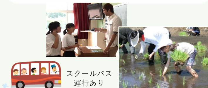
スクールバス 運行あり

市内で初めて「学校運営協議会」を設置。地域の意見や力を学校運営に反映します。黒保根で学ぶことに誇りをもち、そんな子供たちを支える地域を目指します。