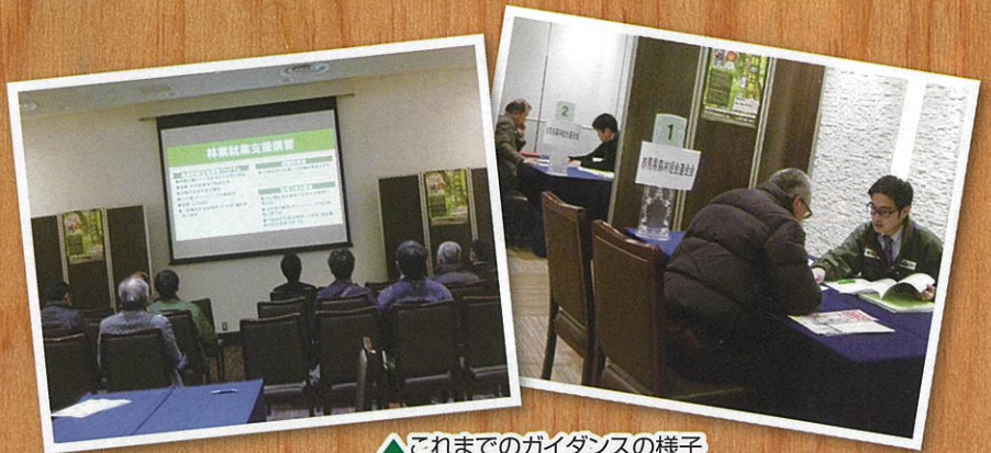
▲これまでのガイダンスの様子