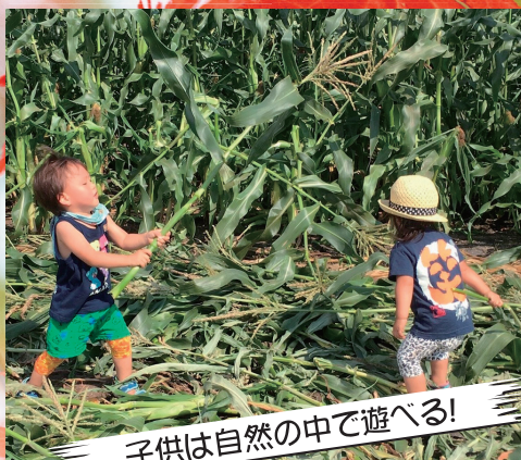
子供は自然の中で遊べる!