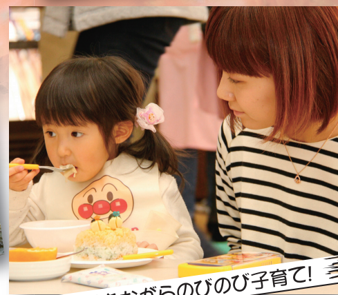
働きながらのびのび子育て!