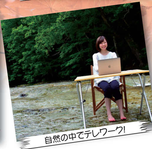
自然の中でテレワーク!