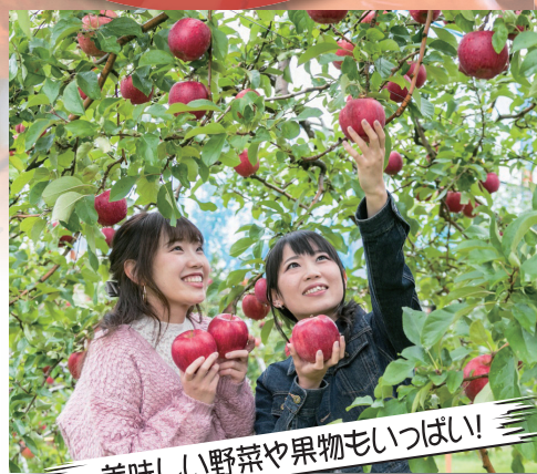
美味しい野菜や果物もいっぱい!