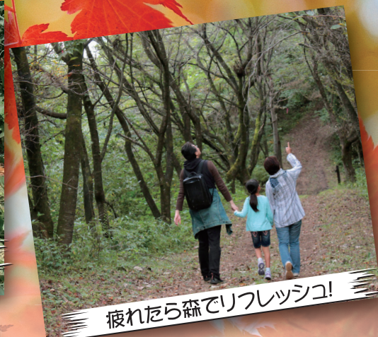
疲れたら森でリフレッシュ!