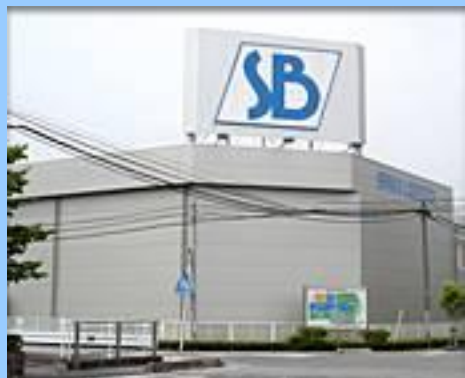
流通センター 【太田市】