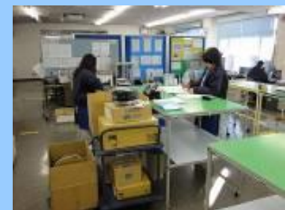
部品ピッキング作業 (JIT生産対応)