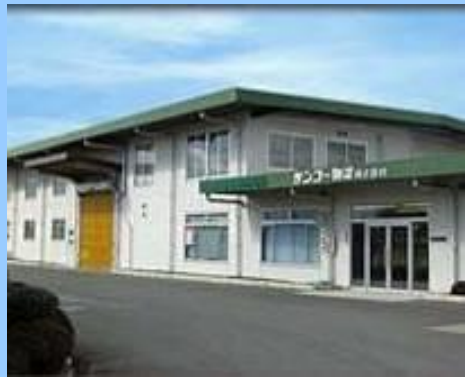
サンコー物流 本社【太田市】

物流のニーズが多様化している現在、常にお客様に最高の満足がいただけるサービスを提供できるよう、物流のスペシャリストとして、多角的な活動を進めてまいります。