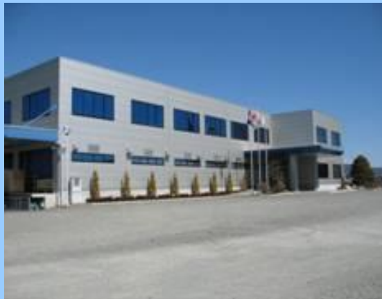
本社工場 【みどり市】

優れたスタッフの育成により、強力なプロフェッショナル集団として、さらにより高度な生産体制の確立を推し進めてまいります。