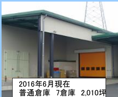
2016年6月現在 普通倉庫 7倉庫 2,010坪