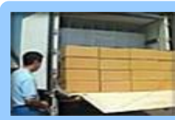
精密機器専用輸送車