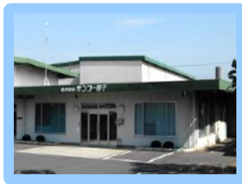
● 営業本部 【群馬県太田市】