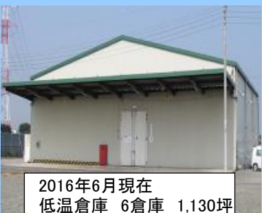
2016年6月現在 低温倉庫 6倉庫 1,130坪