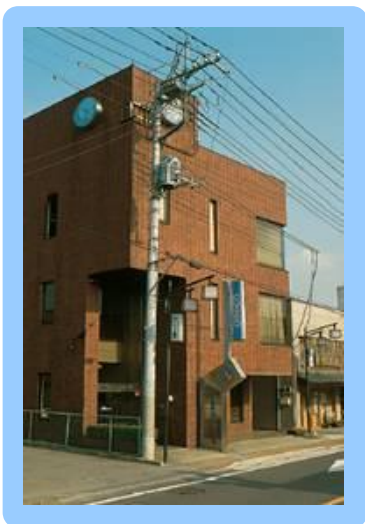
● 本 社 【群馬県みどり市】

専門分野をもつ企業を集結させたグループ体制は、フレキシブルな「顧客要求」を実現します。