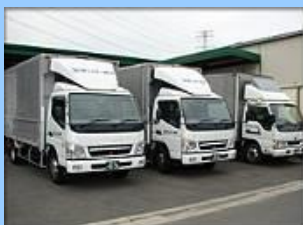
1t車両～4t車両 計12台保有