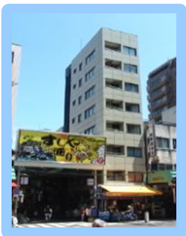
● 東京営業所 【東京都台東区浅草】