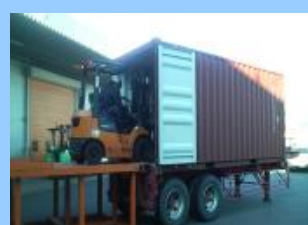
バンニング/デバンニング作業対応