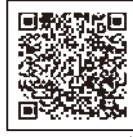
群馬県マッチングサイト

群馬県または他の都道府県が開設する マッチングサイト に掲載された対象求人に応募して採用された方