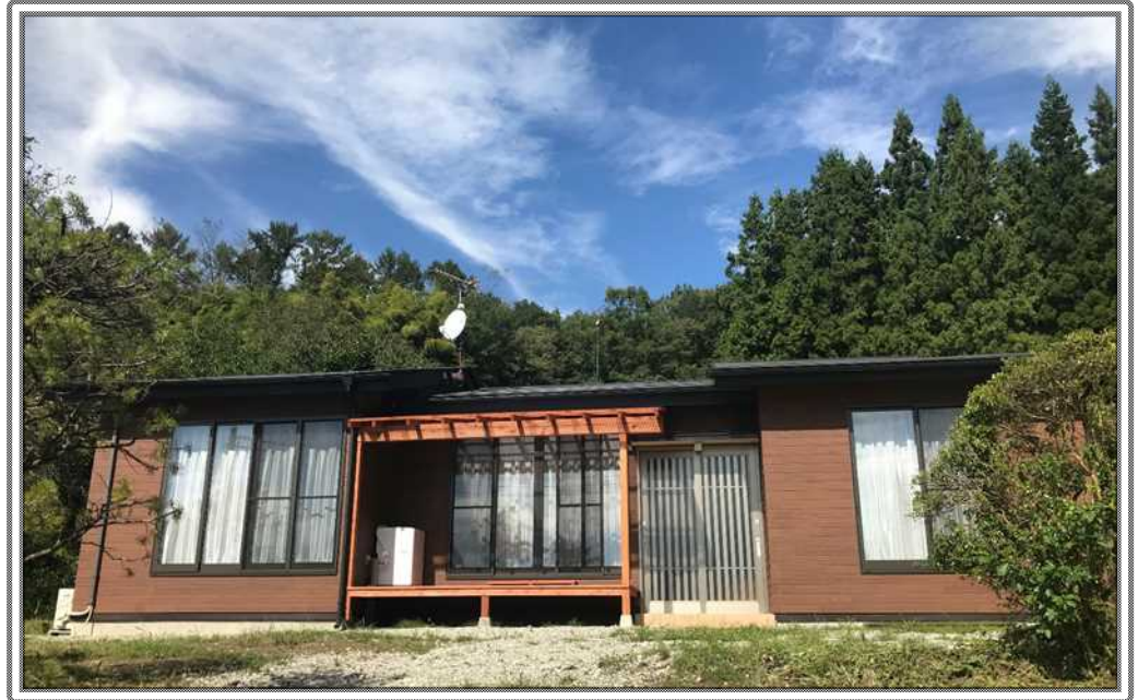
古民家を改修した移住体験住宅

中之条町では、移住希望者が「中之条で暮らす。」体験ができる「移住体験住宅」を用意しています。