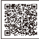
群馬県マッチングサイト

群馬県または他の都道府県が開設する マッチングサイト に掲載された対象求人に応募して採用された方