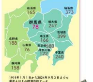
震度4以上の地震回数

群馬県は関東地方で一番地震が少ない地域です。(気象庁震度データベース1919年1月1日~2024年9月3日による)